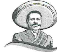
CONCEJAL MARÍA DE LOS ÁNGELES PELAGIO FLORES