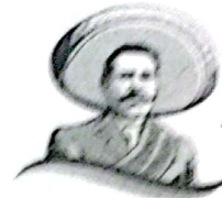
CONCEJAL MARÍA DE LOS ÁNGELES PELAGIO FLORES